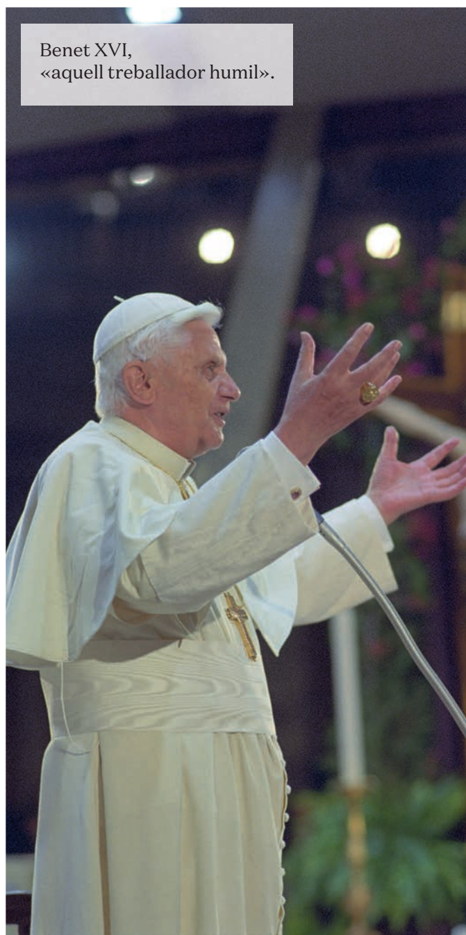
Benet XVI, «aquell treballador humil».

L'arrel dels Pares li donava solidesa en l'enlairament compacte de l'edifici de la seva lògica teològica fins al cel