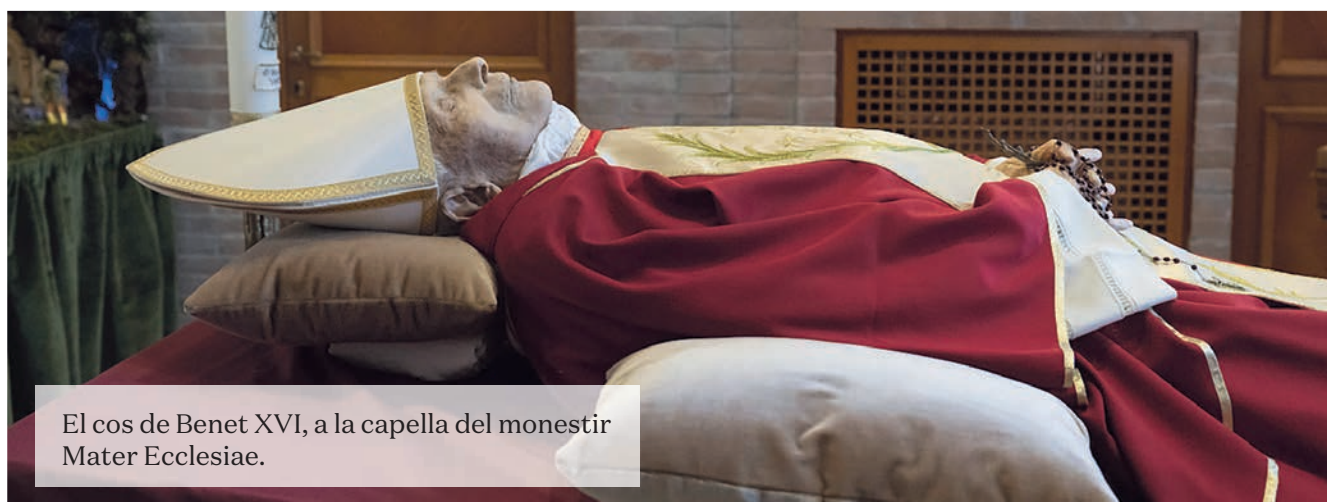
El cos de Benet XVI, a la capella del monestir Mater Ecclesiae.

L'11 de febrer del 2013 anuncia per sorpresa, en llatí, la seva renúncia per manca de forces. Aquest gest es considera excepcional perquè és la primera renúncia des de l'edat mitjana. Es fa efectiva el 28 de febrer. Unes setmanes després de l'elecció de Francesc, Benet XVI es retira al monestir Mater Ecclesiae, dins dels murs del Vaticà, on viu dedicat a la pregària fins a la seva mort.