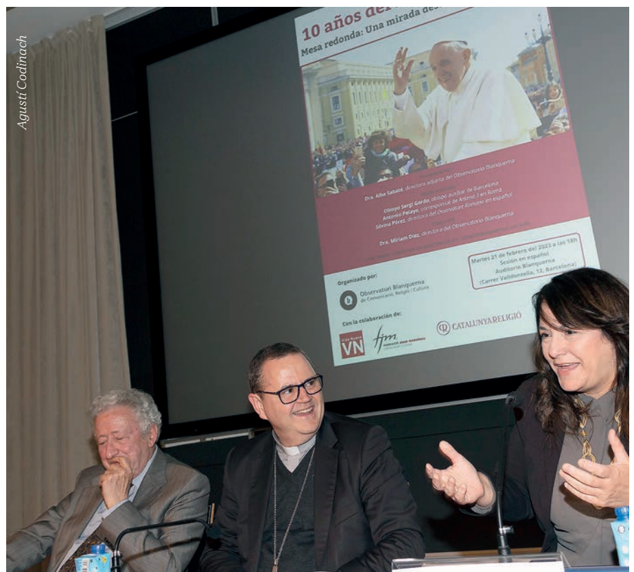
Acte de la Fundació Joan Maragall.