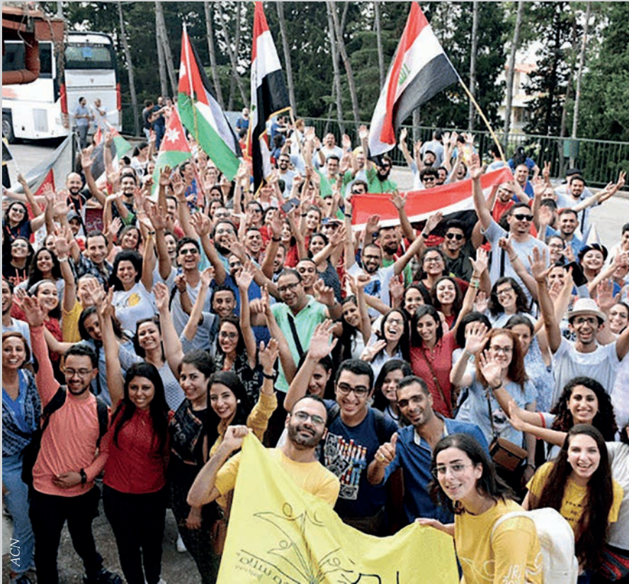
Els joves sirians i libanesos també han pogut viure la JMJ.