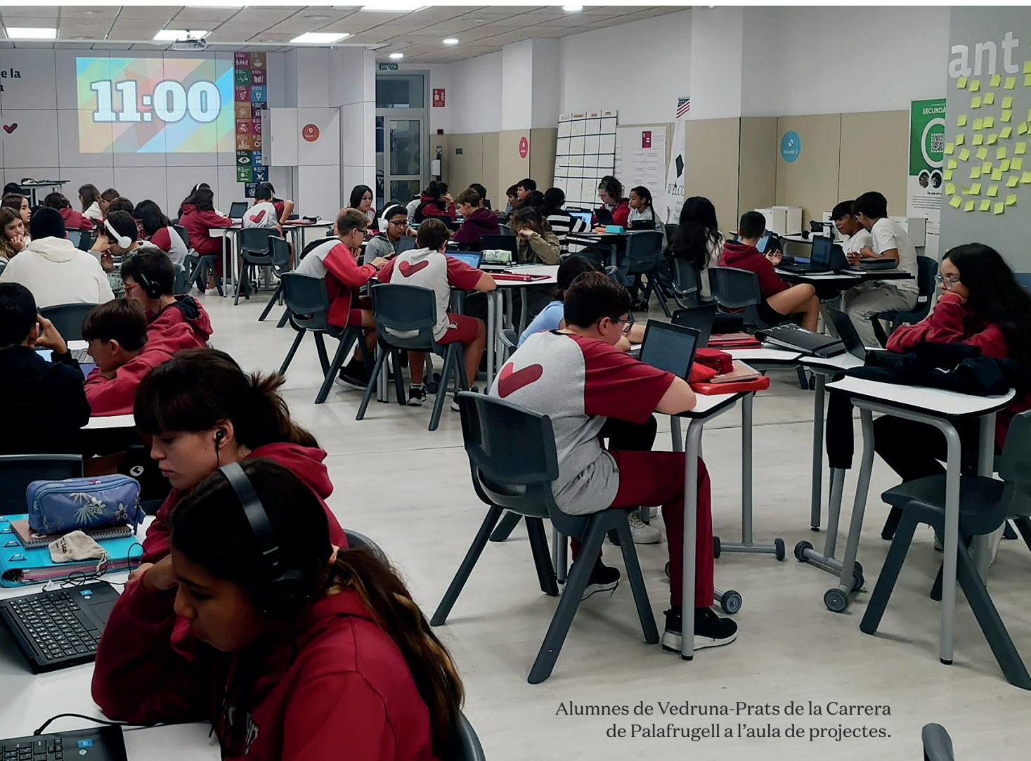
Alumnes de Vedruna-Prats de la Carrera de Palafrugell a l'aula de projectes.

S'ha fet una feineda des dels diferents equips de treball de la fundació per adequar el projecte educatiu als nous temps sense perdre l'essencial. Eduquem en els valors que creiem que han de forjar la societat d'avui i de demà. Acolim tothom i seguim el carisma de la nostra fundadora, santa Joaquina de Vedruna, una dona valenta que va donar un cop de volant a la seva vida per dedicar-se als col·lectius vulnerables d'aleshores: els pobres, els malalts i les nenes. L'educació és això: només avançarem si incloem tothom.