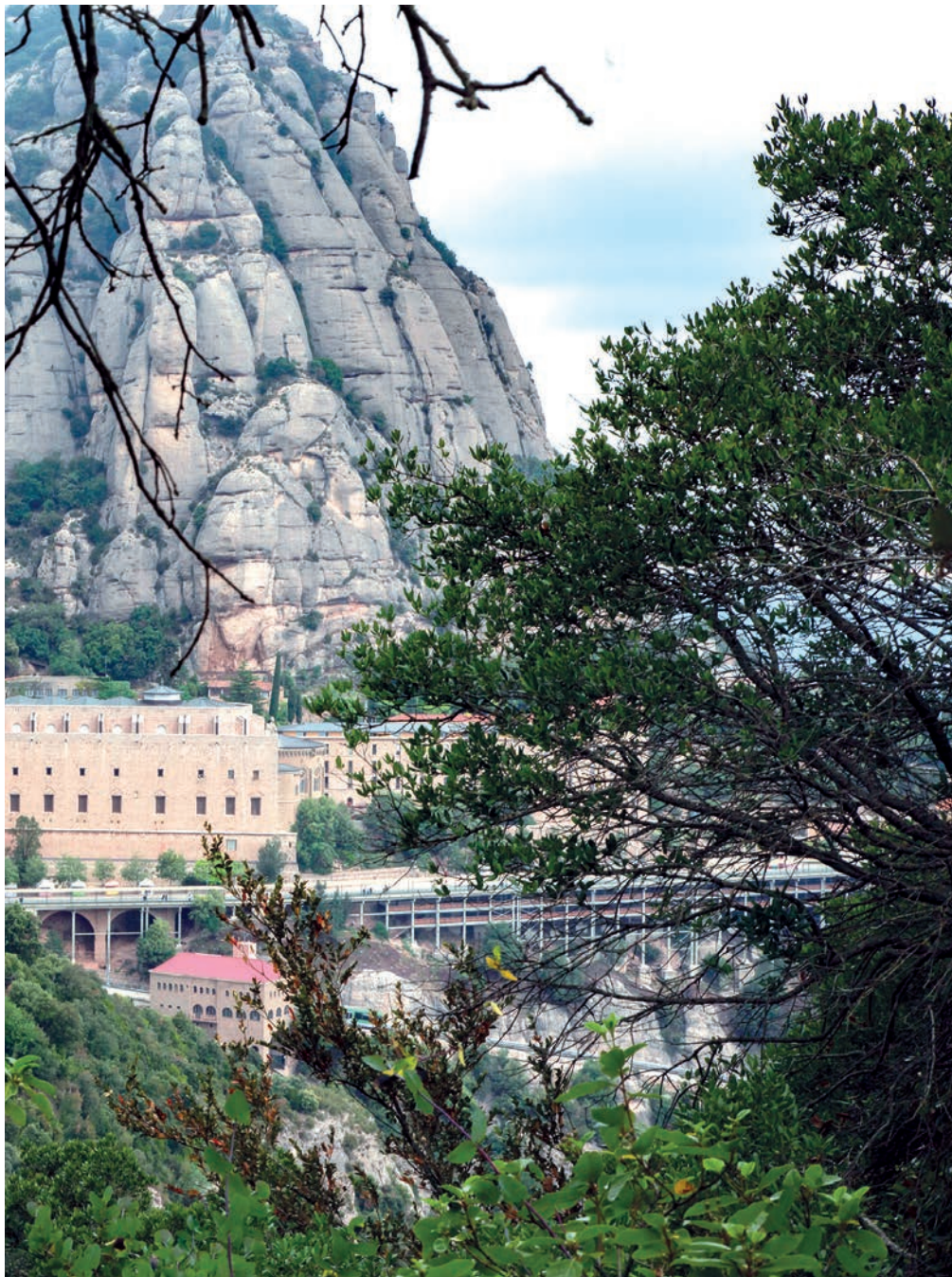
Foto: Montserrat, una muntanya que sempre produeix una certa impressió.

universitat. Després vaig començar a fer els estudis eclesiàstics d'aquí. Entremig hi havia el costum que alguns monjos anessin a fora per aprendre idiomes i conèixer món. I el 1966 vaig anar al monestir de Münsterschwarzach, a Francònia. El 1970 hi vaig tornar. Aquest cop, al monestir de Sankt Bonifaz, a Munic, on vaig estudiar durant un semestre. Al cap d'un parell d'anys vaig anar una setmana a Tübingen, on vaig treballar una setmana a la biblioteca de la universitat, com vaig fer, igualment, a Basilea i a Estrasburg.